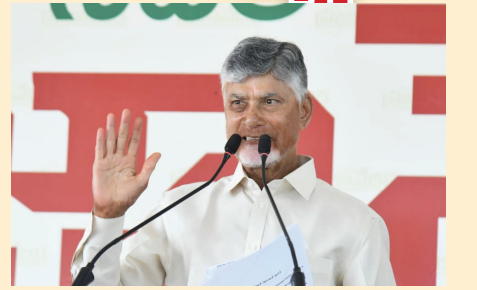
వికంగా రూ.19,305 కోట్లు కేటాయించామని తెలిపారు. యూనివర్సల్ హెల్త్ పాలసీ ద్వారా

మహిళల్లో అత్యధికంగా వస్తున్న సర్వైకల్ క్యాన్సర్ ను అరికట్టేందుకు 15 ఏళ్లలోపు బాలికలకు హెచ్పీవీ టీకాలను ఉచితంగా అందిస్తున్నట్లు చంద్రబాబు వెల్లడించారు. బయట మార్కెట్లో రూ.4 వేలు ఉండే ఈ టీకాను, రాష్ట్రంలోని 3.45 లక్షల మంది బాలికలకు ఉచితంగా అందించేందుకు రూ.14.11 కోట్లు ఖర్చు చేస్తున్నామన్నారు. కర్నూలులో రూ.50 కోట్లతో స్టేట్ క్యాన్సర్ ఇన్స్టిట్యూట్ ఏర్పాటు చేస్తున్నామని, తాజా బడ్జెట్లో వైద్య రంగానికి